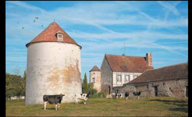
BOUY-SUR-ORVIN. Avec sa tour et son pigeonnier, la ferme du château est emblématique du village natal du sculpteur Alfred Boucher.