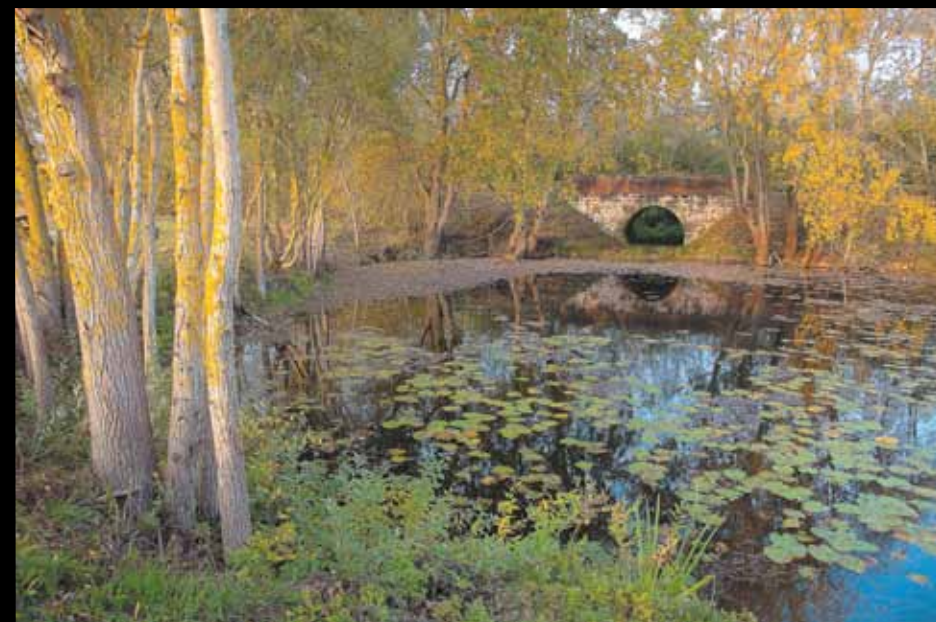
PLAN D'EAU DU MONTEUIL. Un écran naturel à deux pas de la ville de Nogent.

Images : Didier Guy. Textes : Marie-Pierre Moyot.