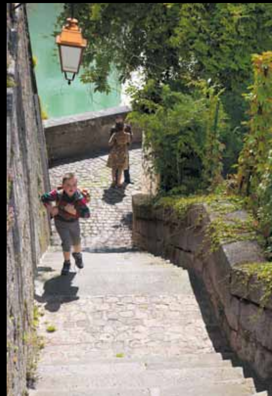
NOGENT-SUR-SEINE. Sortie d'école, balade en amoureux... Doux instants à partager, quai des Granges.