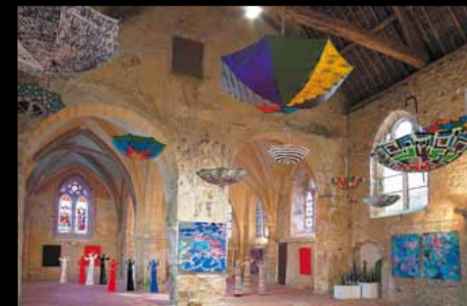
DIVAL. Dans la pittoresque vallée de la Noxe, près de Villenaux-la-Grande, la petite église de Dival est désormais vouée au culte des arts.