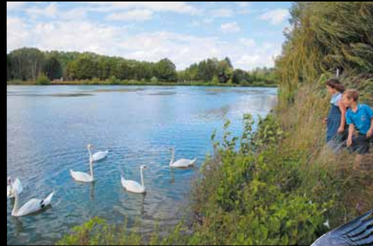
BERGE DE LA SEINE À NOGENT. Des enfants s'amuse à attirer l'attention des cygnes.