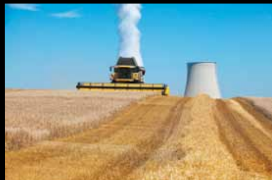
MOISSONNEUSE. La centrale nucléaire, silhouette devenue familière dans l'immensité des cultures céréalières.