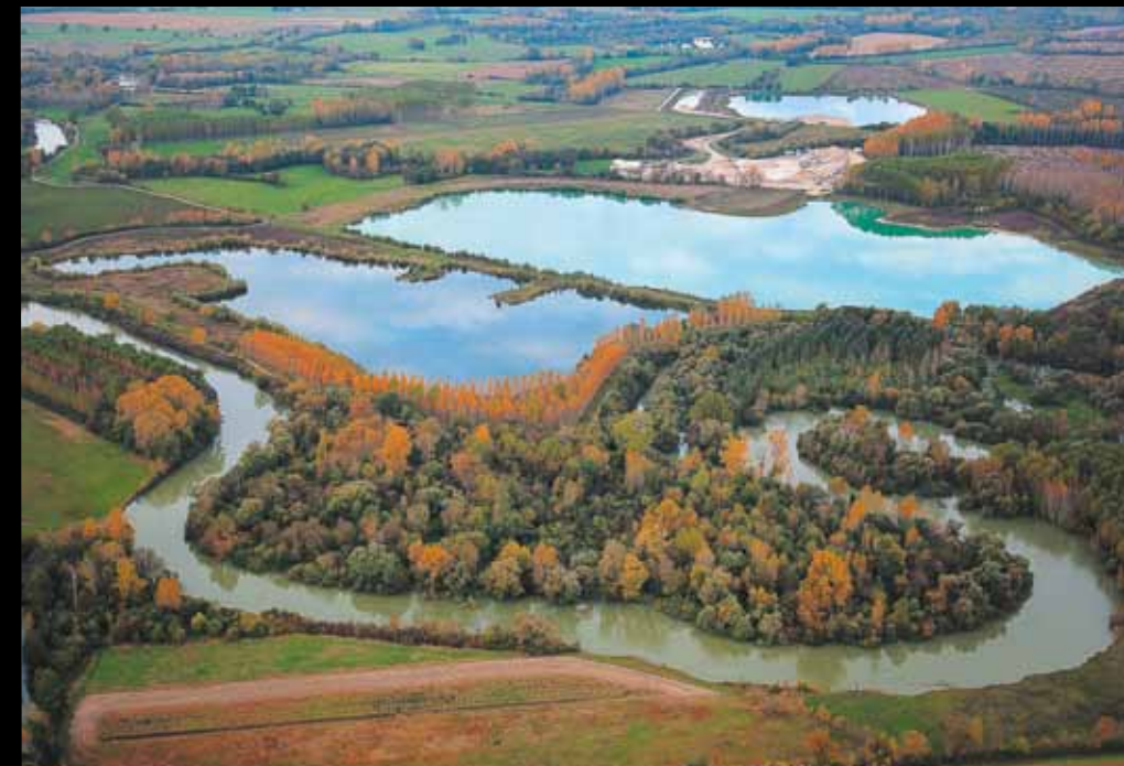
PLAINE DE LA BASSÉE. Principale source de granulats pour le Bassin parisien, les gravières servent de sanctuaire aux oiseaux : grèbe huppé, héron cendré (photo page précédente), etc.