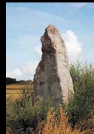
SAINT-AUBIN. Haut de 3 mètres, le menhir de la Grande Pierre est classé monument historique.