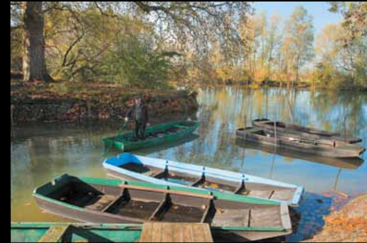
PONT-SUR-SEINE. Des bachots, ces barques à fond plat cintrées au feu de bois utilisées pour la pêche ou la promenade, mouillent au port des Épinettes.