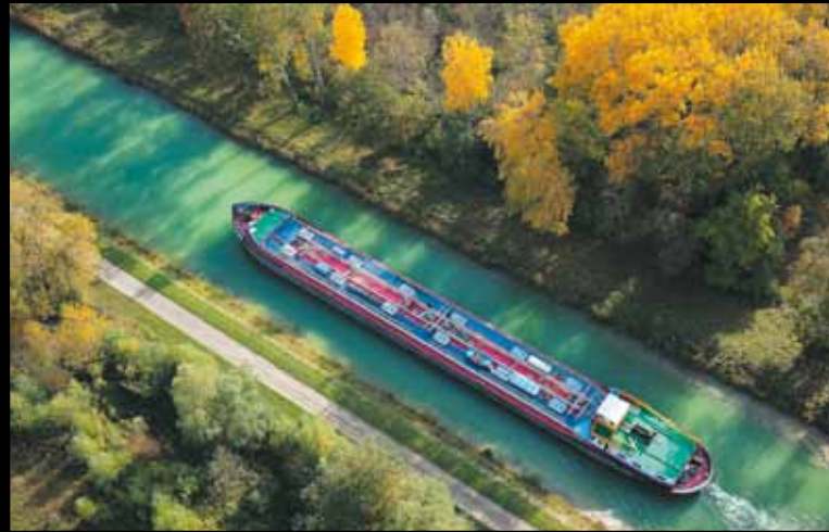
CANAL DE LA HAUTE-SEINE. La barge "tanker" remonte le canal en direction de l'usine du Mériot pour embarquer du biocarburant.