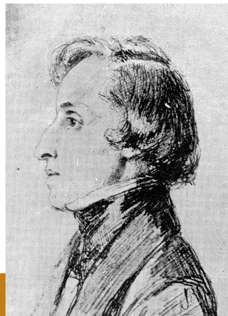
Frédéric Chopin dessin de Franz Xaver Winterhalter.