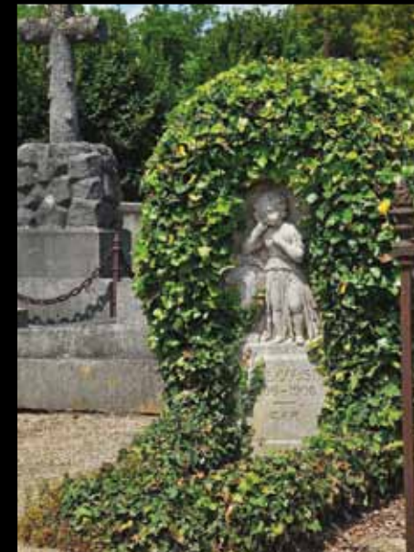
ARCIS-SUR-AUBE. La nature a tissé un manteau de lierre autour du chérubin.