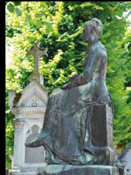
NOGENT-SUR-SEINE. Des œuvres d'Alfred Boucher à découvrir, telle la statue de son épouse sur leur sépulture.