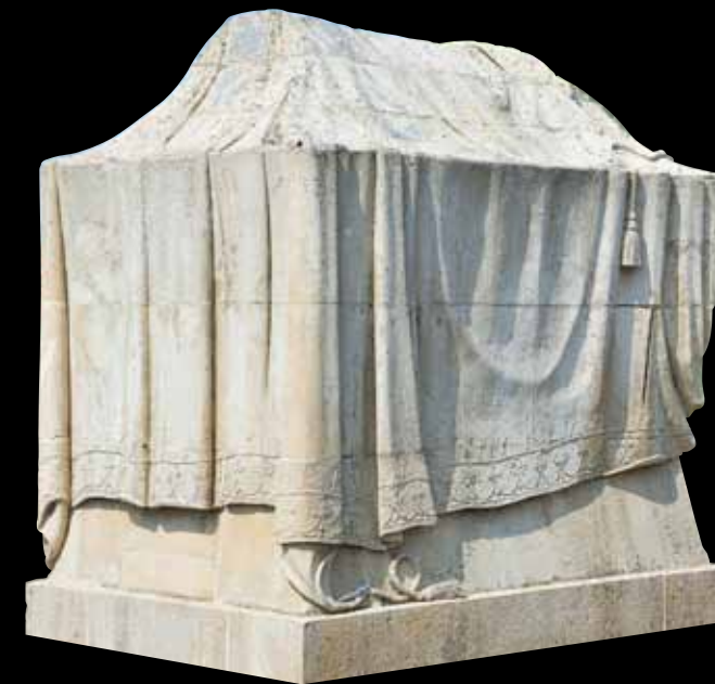
AIX-EN-OTHE. D'anciens notables aixois reposent dans cette chapelle typique de l'art funéraire du XIX e siècle, avec ses drapés sculptés dans la pierre.