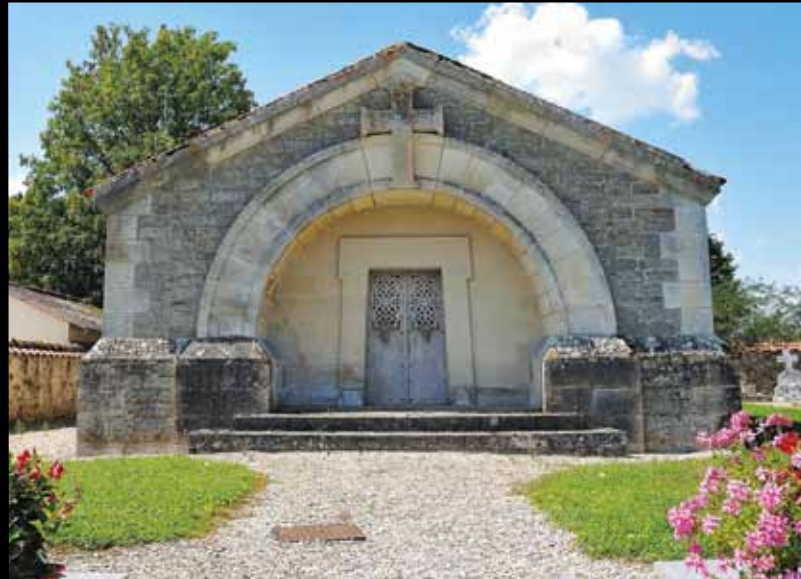
PONT-SUR-SEINE. Dans cette imposante chapelle, reposent des membres de la famille de Jean Casimir-Périer, président de la République (1894-1895).