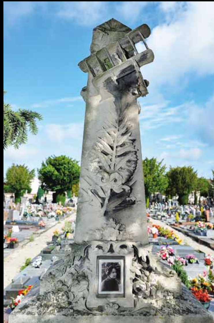
TROYES. Un petit biplan surmonte la tombe de Suzanne Bernard, pionnière de l'aviation, décédée en vol à 18 ans, lors des épreuves de son brevet en 1912.