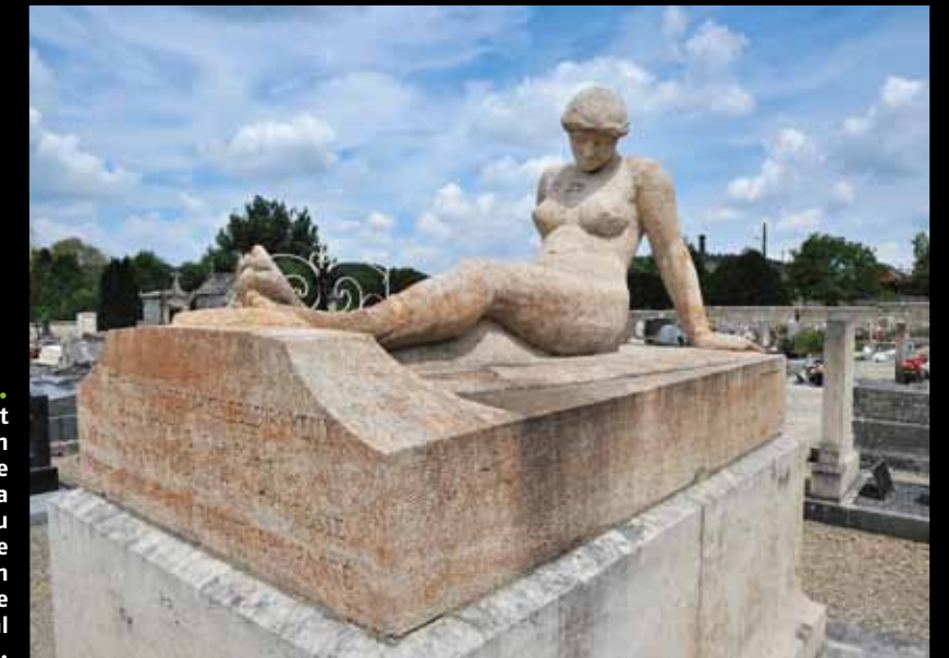
ESSOYES. La population s'était fortement émue en 1914, à la découverte du tombeau de la famille Pichon. Ce nu audacieux, hommage d'un homme à son épouse, est l'œuvre du sculpteur local Louis Morel.