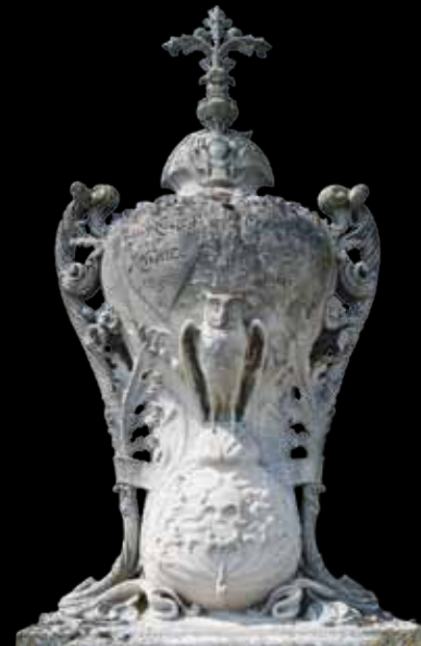
TROYES. Le temps qui passe (sablier), l'amour (deux cœurs réunis), les arts et la sagesse (chouette) triomphant de la mort... Que de symboles sur ce monument très Art déco.