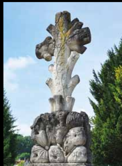
BAR-SUR-SEINE. Une croix enlacée de fleurs et de lierre, symbole d'éternité et d'attachement.