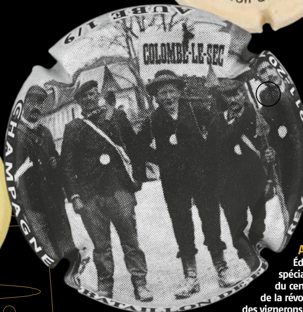
AUBE. Édition spéciale du centenaire de la révolte des vignerons. Ici, le bataillon de fer.