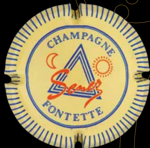
FONTETTE. CRISTIAN SENEZ. Sur cette capsule, des symboles francs-maçons.