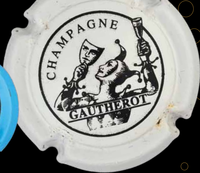
CELLES-SUR-OURCE. GAUTHEROT. Arlequin tombant le masque, grisé par le champagne... Une référence au "gautherot", un personnage facétieux du Moyen Âge.