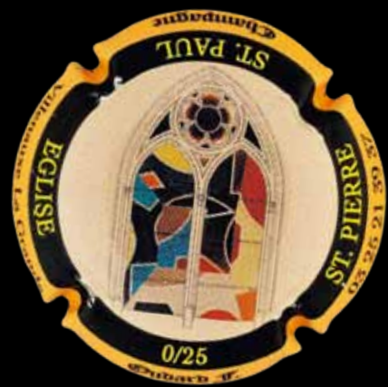
VILLENAUXE-LA-GRANDE. OUDARD. L'une des 25 capsules aux couleurs des vitraux contemporains de David Tremlett.