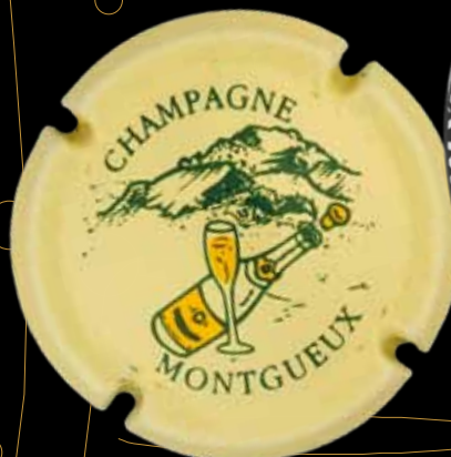
MONTGUEUX. Sur cette colline de craie, ici dessinée, la vigne se serait développée dès l'époque gallo-romaine.