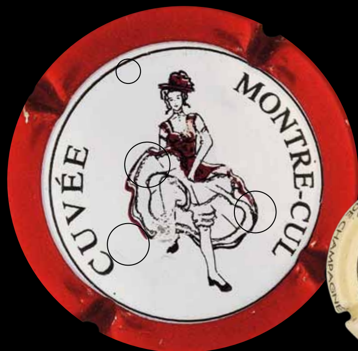
CELLES-SUR-OURCE. DELOT. La danseuse de french cancan. Parfaite pour représenter la cuvée vinifiée à partir de la seule parcelle Montre-cul!

Avec l'aimable concours de Pierre Morand, placomusophile de l'Aube. Textes: Marie-Pierre Moyot.