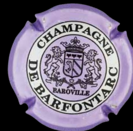
BAROVILLE-FONTAINE-ARCONVILLE. BARFONTARC. Des armoiries déclinées en 5 couleurs, dont cet élégant violet.