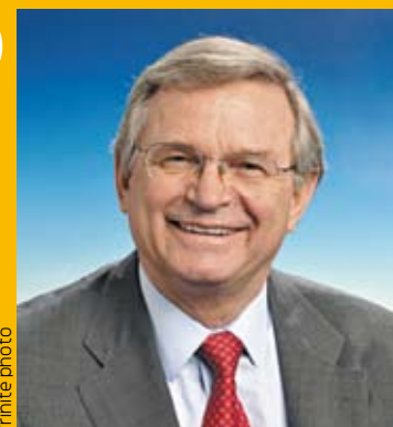
PHILIPPE ADNOT, sénateur, président du Conseil général de l'Aube.