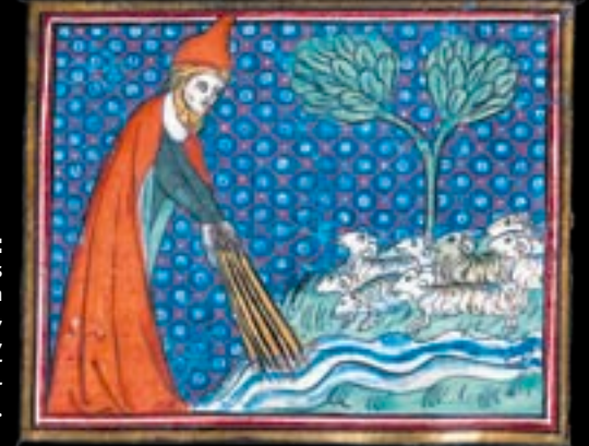
▶ MINIATURE Jacob plantant des verges dans l'eau où boit son troupeau. Bible historique , "Livres de la Genèse", Pierre le Mangeur (traduction française par Guyart des Moulins), XIV e s.