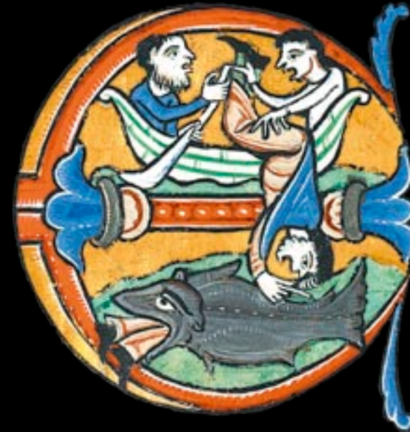
◀ INITIALE E SUR FOND D'OR Jeté à la mer, le prophète Jonas est englouti par le poisson. Bible de saint Bernard , "Livres de Jonas" (XII e s.).