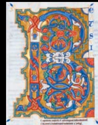
▲ INITIALE B ORNÉE Au centre, un muflon de fauve réunit les deux boucles de ce B au décor raffiné, détail d'un manuscrit de luxe. Psautier glosé du prince Henri (avant 1140).