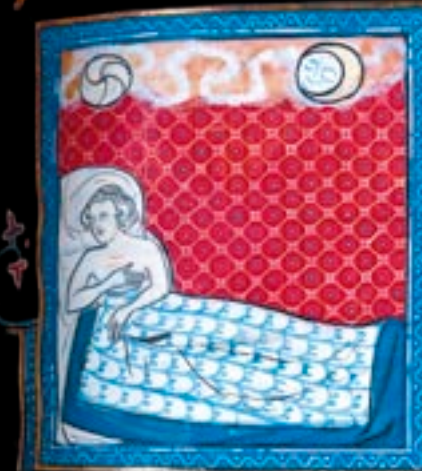
▲ MINIATURE Le songe d'Astyage, roi des Mèdes (V e s. avant J.-C.). Bible historique , "Livres de Cyrus", Pierre le Mangeur (traduction française par Guyart des Moulins), XIV e s.