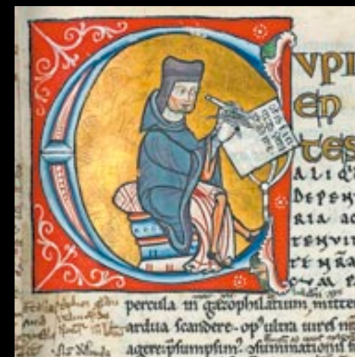
▲ LETRINE C HISTORIÉE Pierre Lombard, coiffé d'un bonnet, écrivant. Ce fut un illustre maître parisien en théologie au XII e s. Sentences , Pierre Lombard (1158).