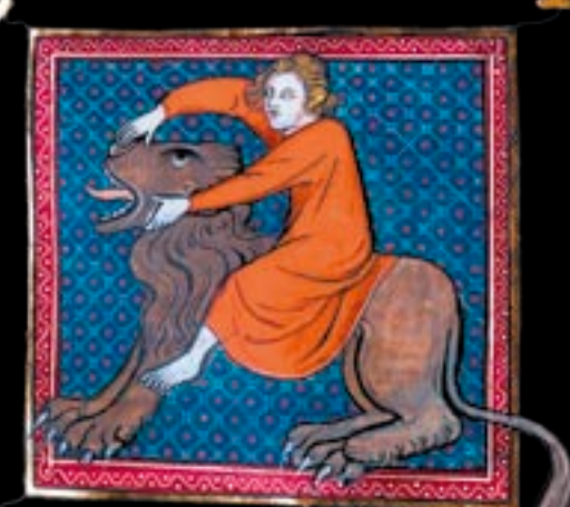
▲ MINIATURE Samson et le lion. Bible historique , "Livres des Juges", Pierre le Mangeur (traduction française par Guyart des Moulins), XIV e s.