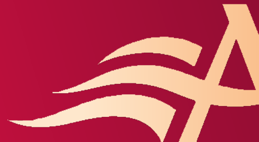
Schéma départemental de développement de la lecture publique Pour des réseaux locaux de bibliothèques attractives

Le schéma départemental de développement de la lecture publique a été approuvé par l'Assemblée départementale le 27 mai 2024.