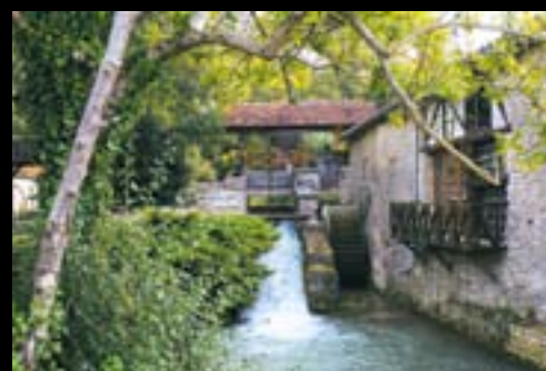
▲ ARRENTIÈRES. Moulin-Rouge, sur la Bresse. Jadis, les rivières du Barrois actionnaient de nombreux moulins.