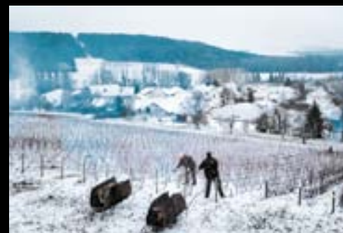
▲ BUXIÈRES-SUR-ARCE. Le travail de la vigne, l'hiver : taille, pliage, liage et entretien des supports.