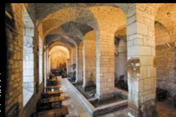
► CLAIRVAUX. Moulin de l'abbaye, puis lavoir de la prison, cette salle est désormais le "mess" des surveillants. On peut s'y restaurer, sur réservation.