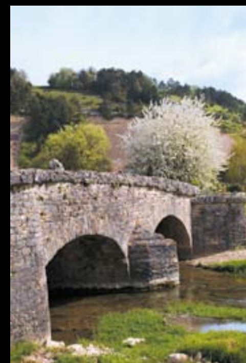
◀ SPOY. Exceptionnel vestige de l'époque romaine. Jusqu'au XVIII e siècle, la route Paris-Bâle passait par ce pont, sur le tracé de l'ancienne voie romaine.