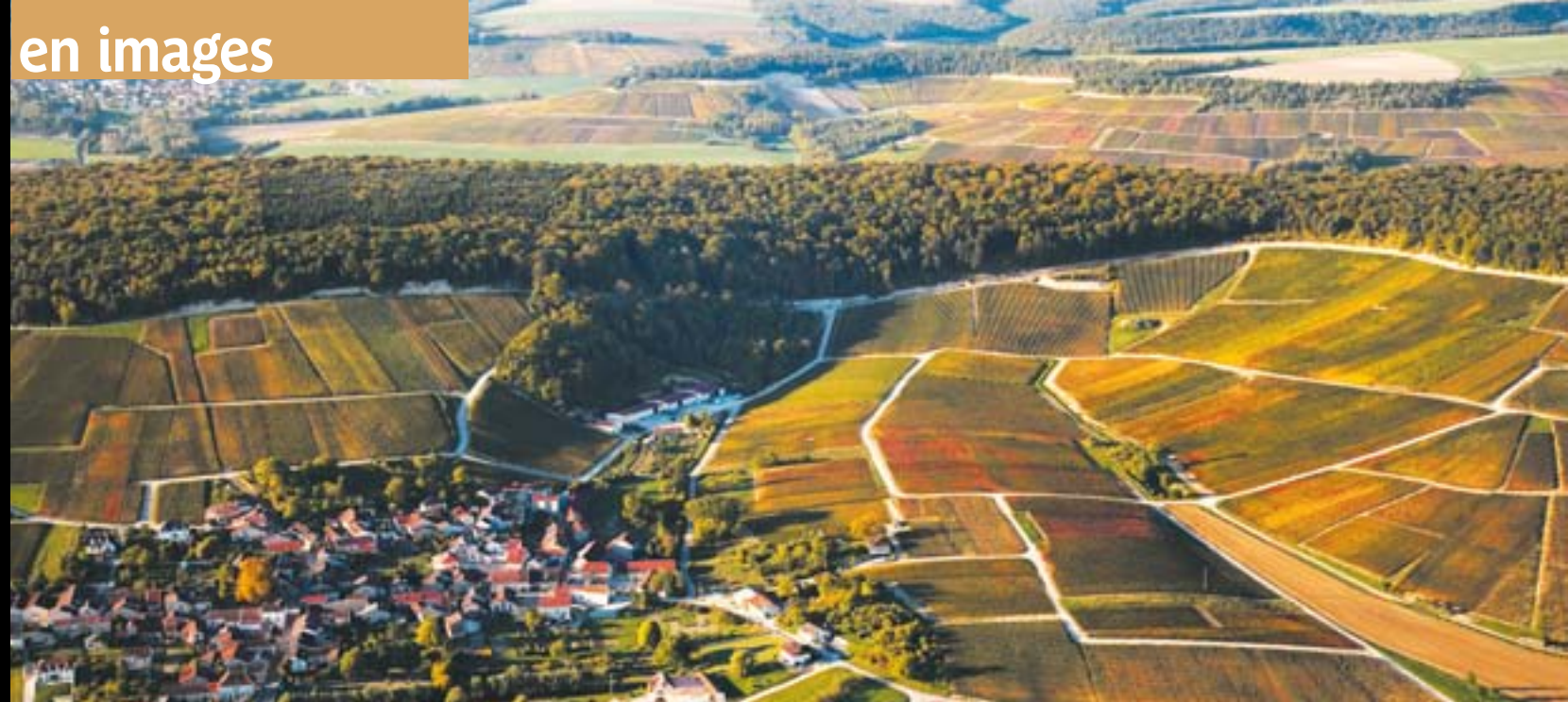
▲ VOIGNY. Un petit village (183 hab.) au cœur d'un immense vignoble. C'est là qu'est née Suzanne, la fille du philosophe de Bar-sur-Aube, Gaston Bachelard.