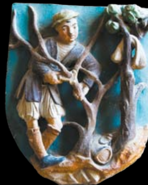
◀ MUSSY-SUR-SEINE. Vigneron travaillant la vigne, sculpté sur l'écu de saint Vincent, patron des vignerons (statue du XVII e siècle, dans l'église).