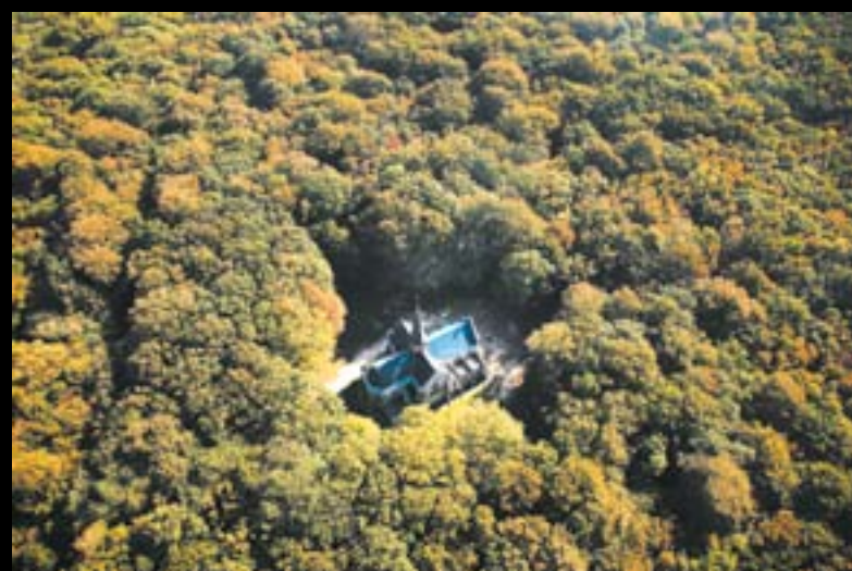
◀ BAR-SUR-SEINE. Sur les hauteurs de la ville, blottie dans un écrin de forêt, la chapelle Notre-Dame-du-Chêne.