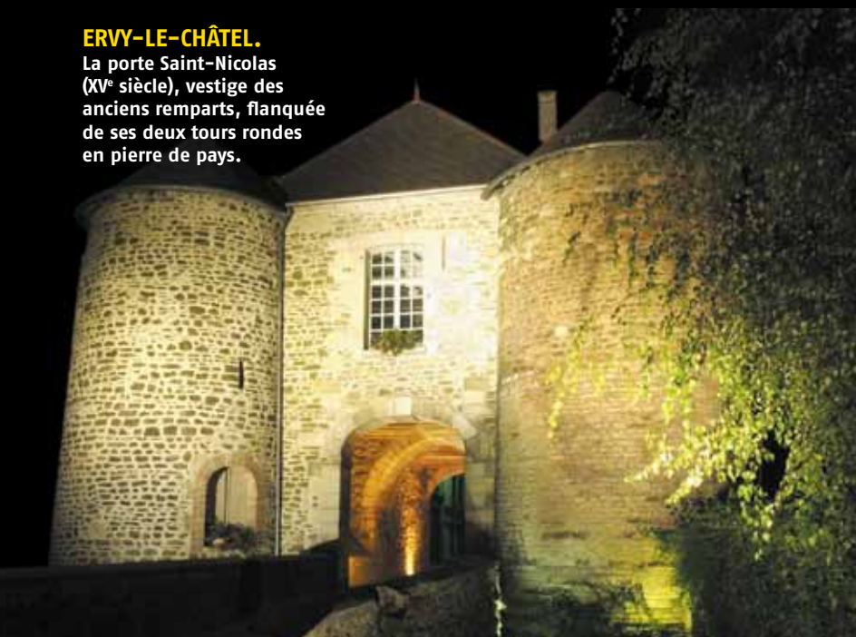
ERVY-LE-CHÂTEL. La porte Saint-Nicolas (XV e siècle), vestige des anciens remparts, flanquée de ses deux tours rondes en pierre de pays.