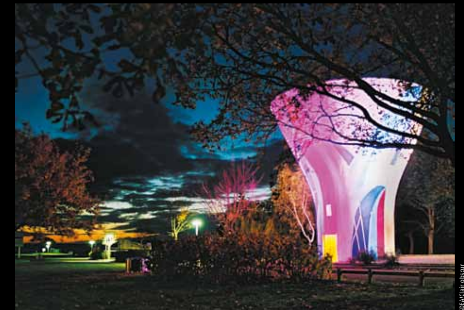
MESNIL-SAINT-PÈRE. Le château d'eau, magnifié par la plasticienne auboise Michèle Caillaud-Houel. Une féerie de lumières.