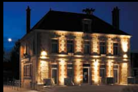
LAVAU. La mairie, au centre du bourg rénové.

Le jour tombe vite en cette période de l'année... Profitons-en pour redécouvrir notre patrimoine et nos lieux de vie dans la magie de la nuit et de la lumière. Texte : Marie-Pierre Moyot.