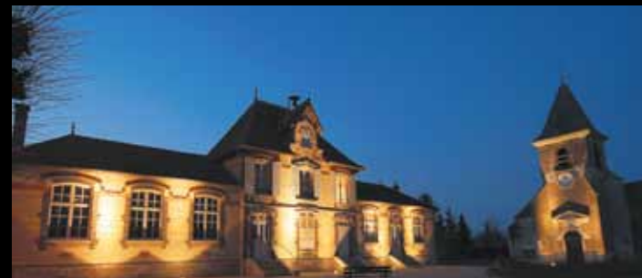
LAINES-AUX-BOIS. La mairie et l'église Saint-Pierre-ès-Liens.