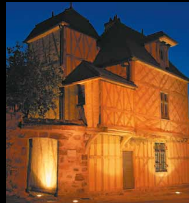
NOGENT-SUR-SEINE. Le pavillon Henri-IV. La légende veut que cette auberge ait accueilli les amours du bon roi avec Gabrielle d'Estrées.