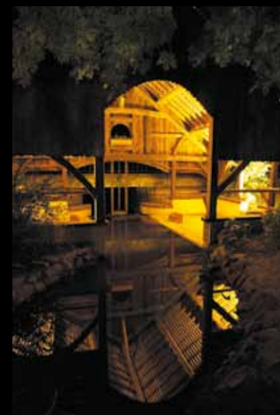
SAINT-MARTIN-DE-BOSSENAY. Le lavoir, sur le ru Saint-Pierre.