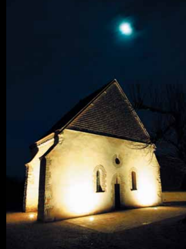
MESNIL-SAINT-LOUP. La chapelle templière.