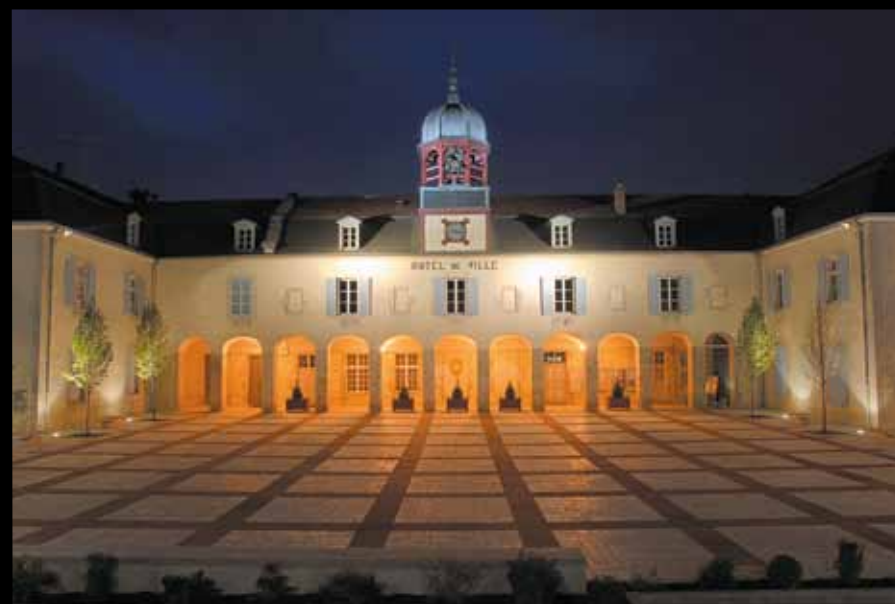
BAR-SUR-AUBE. L'hôtel de ville, avec son vaste parvis à damier.