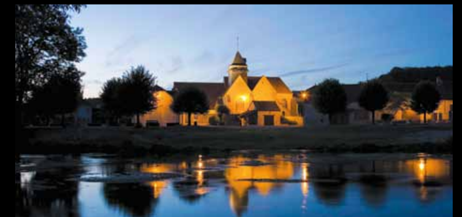
BOURGUIGNONS. L'église Saint-Vallier se mire dans la Seine.

Le Conseil général subventionne le SDEA pour les travaux d'électrification rurale (600 000 euros en 2012).