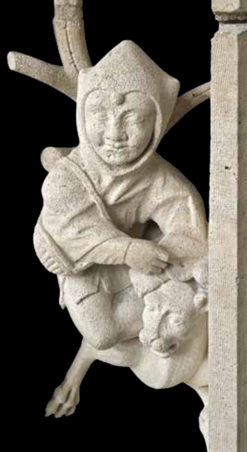
FOU ACCOMPAGNÉ D'UN CHIEN. Très populaire au Moyen Âge, la fête des fous était célébrée de Noël à l'Épiphanie. Pendant quelques jours, c'était le monde à l'envers!