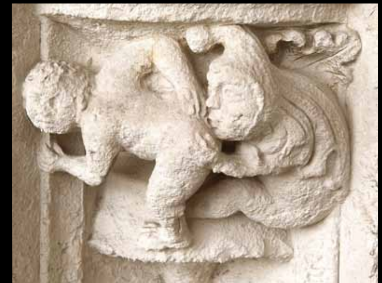
SOUFFLE AU CUL. Tradition carnavalesque du Moyen Âge? À cette époque, le pet était considéré comme le diable qui s'échappait par l'orifice anal.