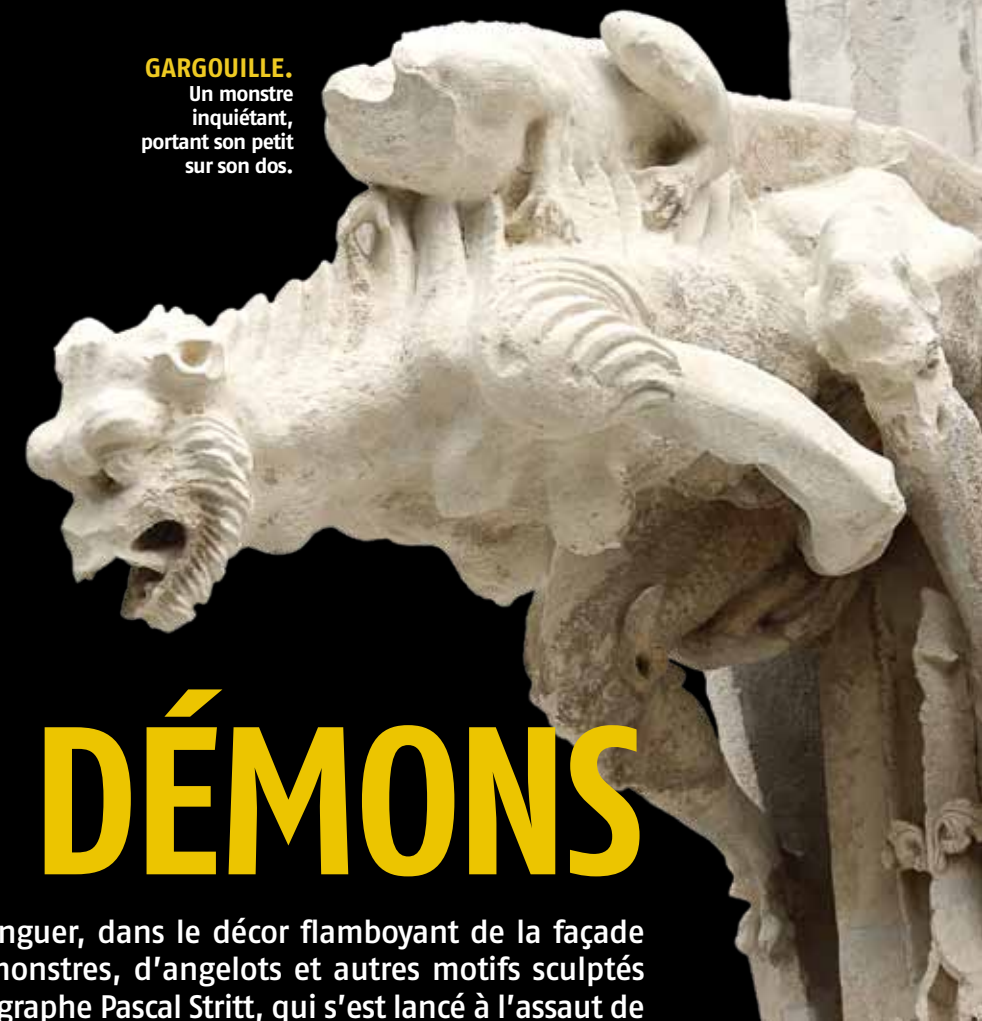
GARGOUILLE. Un monstre inquiétant, portant son petit sur son dos.