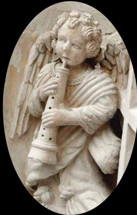
ANGE JOUANT D'UN HAUTOIS. Que de raffinement dans le vêtement et la chevelure de ce gracieux musicien!