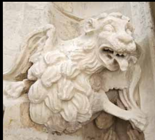
BÊTE FANTASTIQUE. Des ailes et une tête de fauve rugissant ne parviennent pas à rendre effrayant cet animal qui a l'air d'un brave lion.