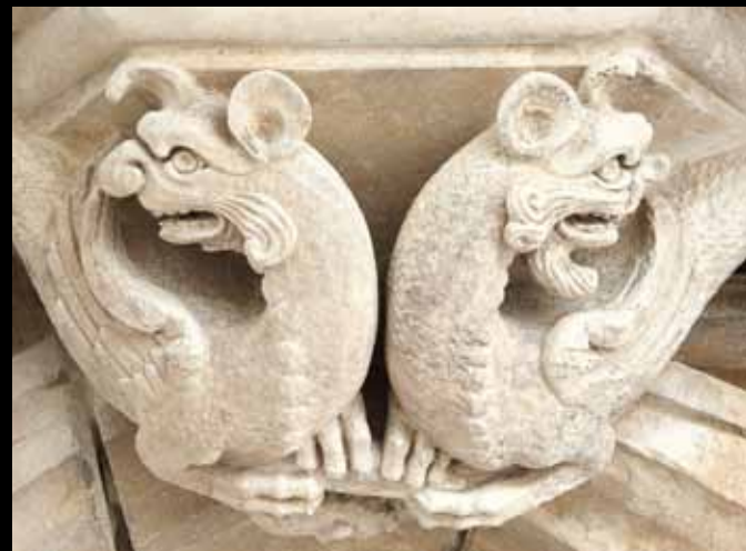
DRAGONS. Imprégnés de l'imaginaire médiéval, les artistes, anonymes, ont ciselé un bestiaire fantastique, peuplé d'animaux aux formes expressives, tourmentées et parfois inquiétantes.