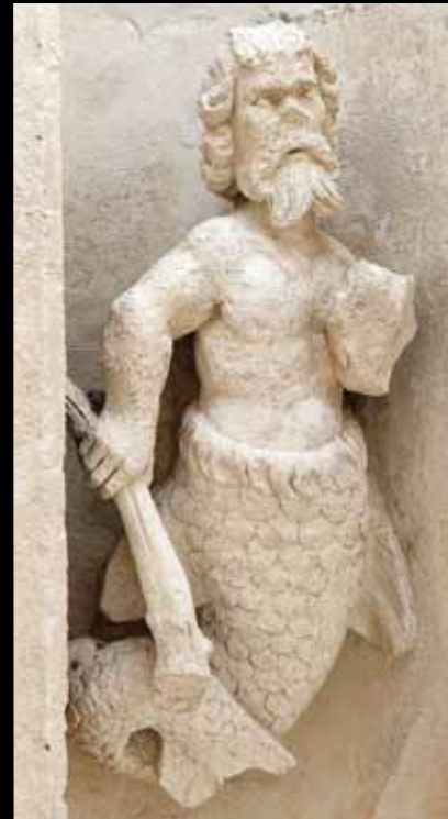
TRITON. Un buste d'homme sur une queue de poisson.