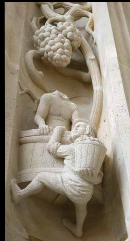
SCÈNE DE VENDANGE. De la treille au pressoir, en passant par la hotte.