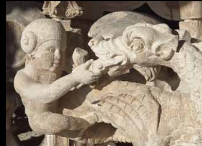
L'ANGE ET LE DRAGON. Le réalisme de la sculpture témoigne de la grande dextérité et du souci du détail des sculpteurs du "Beau XVI e siècle" troyen.