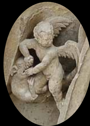
ANGELOT. Un détail invisible depuis le parvis.