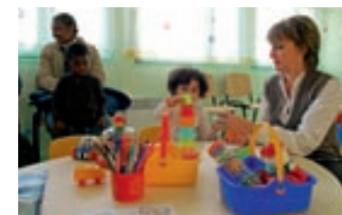
LE JEU pour nouer le lien avec l'enfant.

Dans l'agglomération troyenne ainsi qu'à Romilly-sur-Seine, vous adorerez patienter en attendant la consultation pédiatrique de la PMI. En salle d'attente, une éducatrice noue des liens avec les petits à travers le jeu. Un moment privilégié de partage, de rencontre... et une première socialisation pour bébé.