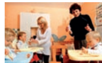
UNE TISF pour aider à l'éducation des enfants.

Si vous ne pouvez pas vous déplacer, la PMI vient à vous: suivi de grossesse par une sage-femme (750 femmes enceintes), visites à domicile ou à la maternité d'une infirmière-puéricultrice après la naissance, aide à la venue d'une technicienne en intervention sociale et familiale (TISF) ou d'une auxiliaire de vie (535 familles aidées). Chiffres 2006.