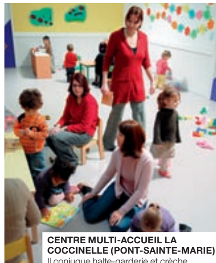
CENTRE MULTI-ACCUEIL LA COCCINELLE (PONT-SAINT-MARIE). Il conjugue halte-garderie et crèche.

Il n'y a pas de mode d'accueil idéal. Mais il y en a forcément un qui vous convient mieux que d'autres. Parlez-en à l'équipe de la PMI, qui exerce une mission de contrôle sur les différents modes de garde: agrément, suivi et formation des assistantes maternelles, conseil, autorisation et suivi des structures multi-accueil (anciennes crèches et haltes-garderies). Dans l'Aube, à l'âge de 2 ans, un enfant sur deux est gardé. Une fois sur deux, il est confié à une assistante maternelle. Quatre fois sur dix, il fréquente, plus ou moins régulièrement, un multi-accueil. Si celui-ci contribue à l'éveil et à la socialisation du jeune enfant, l'assistante maternelle offre un cadre plus familial. Elle n'est toutefois pas isolée, grâce à l'existence des "relais assistantes maternelles", qui sont autant de lieux d'échanges et de rencontres. Si vous optez pour l'assistante maternelle, informez-vous