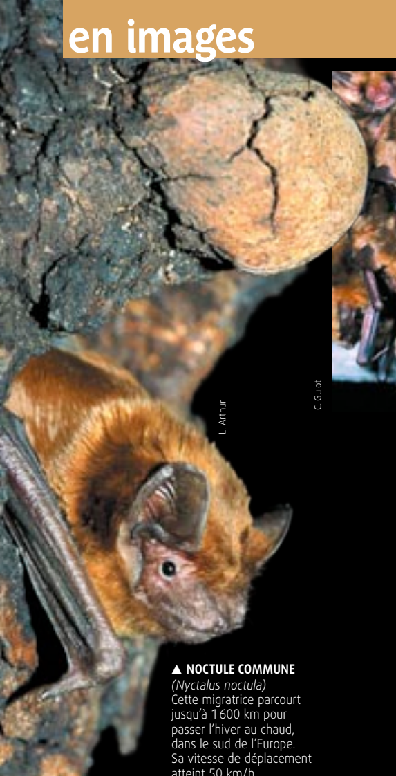
▲ NOCTULE COMMUNE ( Nyctalus noctula ) Cette migratrice parcourt jusqu'à 1 600 km pour passer l'hiver au chaud, dans le sud de l'Europe. Sa vitesse de déplacement atteint 50 km/h.