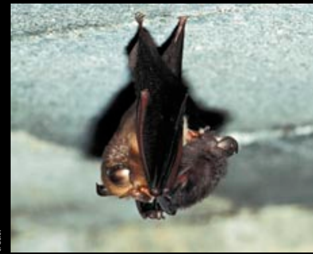
▲ PETIT RHINOLOPHE ( Rhinolophus hipposideros ) Femelle allaitant son jeune (au pelage plus gris), tête-bêche. À l'âge de 4 à 6 semaines, le petit apprendra à voler et à chasser.