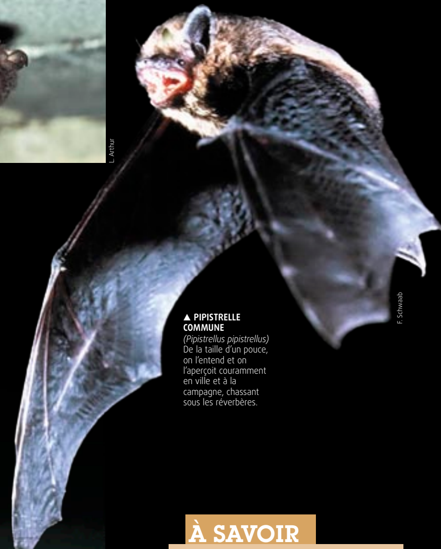
▲ PIPISTRELLE COMMUNE ( Pipistrellus pipistrellus ) De la taille d'un pouce, on l'entend et on l'aperçoit couramment en ville et à la campagne, chassant sous les réverbères.