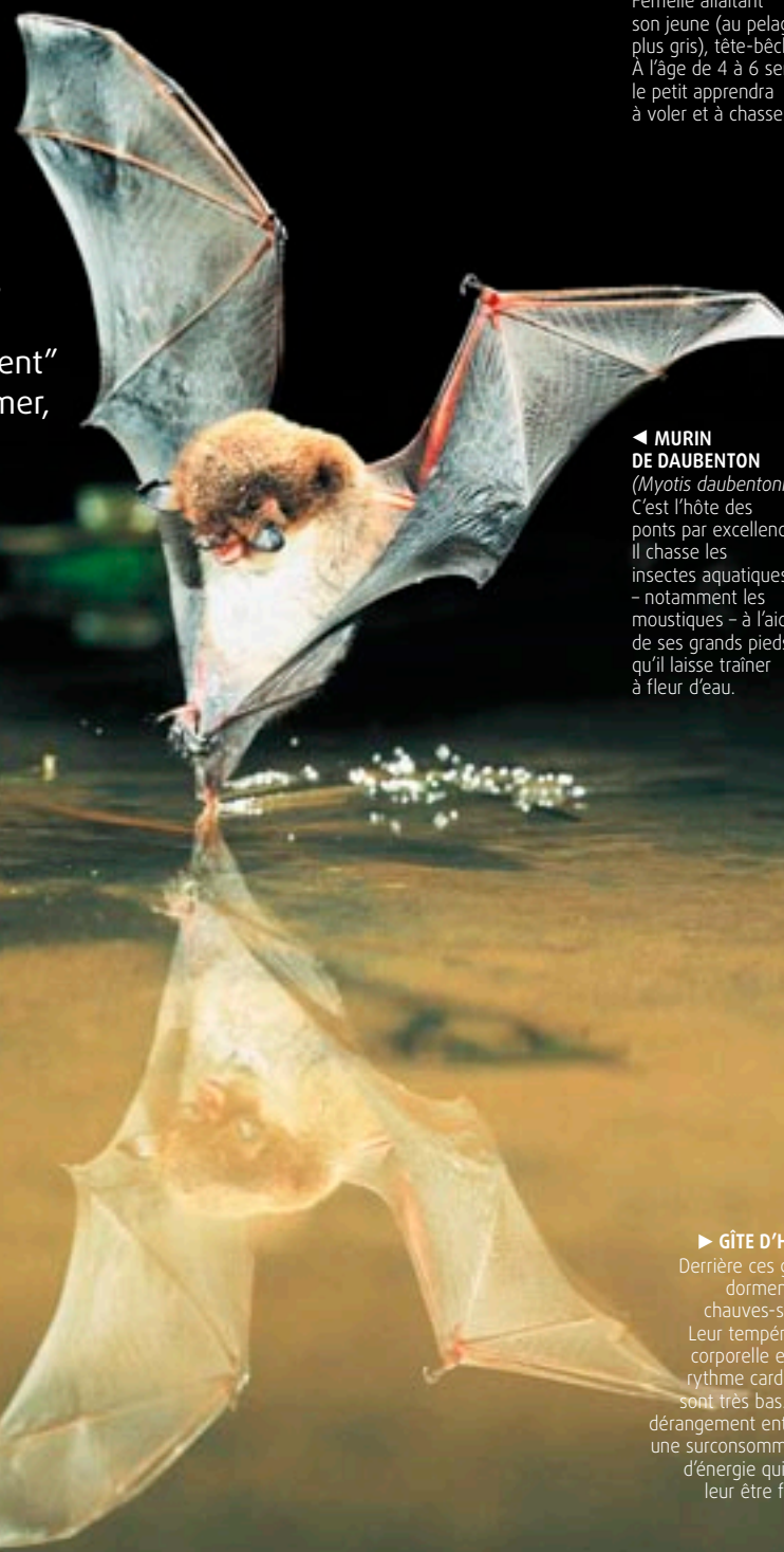
◀ MURIN DE DAUBENTON ( Myotis daubentonii ) C'est l'hôte des ponts par excellence. Il chasse les insectes aquatiques – notamment les moustiques – à l'aide de ses grands pieds qu'il laisse traîner à fleur d'eau.

Loin d'être chauves, ces "souris chouettes" sont d'inoffensifs mammifères nocturnes âgés de 50 millions d'années. Elles volent avec leurs mains – d'où leur nom scientifique de chiroptère, signifiant mains ailées – et "voient" avec leurs oreilles en utilisant un radar. Très utiles, elles peuvent consommer, en une nuit, un tiers de leur poids en insectes. Textes: Marie-Pierre Moyot