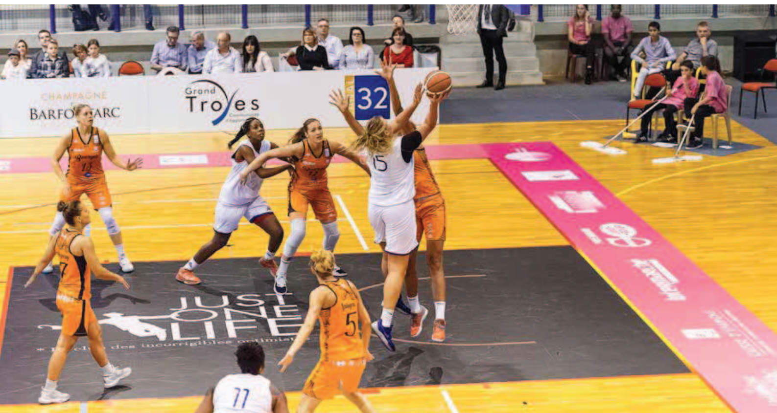
Au gymnase Fernand-Ganne (Saint-Julien-les-Villas) : match de l'Open de la Ligue féminine de basket-ball (LFB).