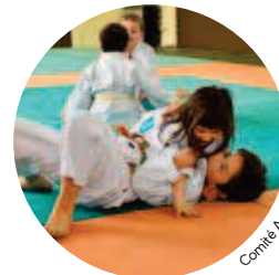
Comité Aube Judo

Près de 200 licenciés, dont quatre sportifs de haut niveau, une cinquantaine de bénévoles rompus à l'organisation de compétitions (Winter Roula3, coupe de France) : tout roule avec l'association BMX Roller Skate de Troyes !