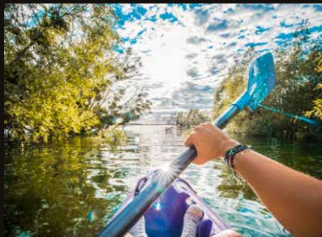
Le Bonheur des gens

Au début de l'été, canoter dans l'entrelacs de la forêt immergée constitue une expérience étonnante.